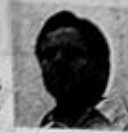
EDUARDO MEDINA MORA, SECRETARIO DE SEGURIDAD PÚBLICA.

“No se tiene ninguna imputación directa de conductas violentas por parte de los policías federales preventivos que participaron en el operativo para restablecer el orden.”