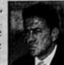
MIGUEL ÁNGEL YUNES, SUBSECRETARIO DE LA SSP.

“Si existieron violaciones, tendrá que ser el MP el que lo determine... no se puede prejuzgar, calificar o señalar que hubo una violación mientras no se dé una denuncia concreta.”