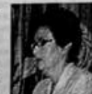
PATRICIA ESPINOSA TORRES, PRESIDENTA DEL INMUJERES.

“Solicitamos que se lleve la investigación hasta sus últimas consecuencias... (se debe) aclarar si los derechos de las mujeres fueron violentados y si fueron violadas.”