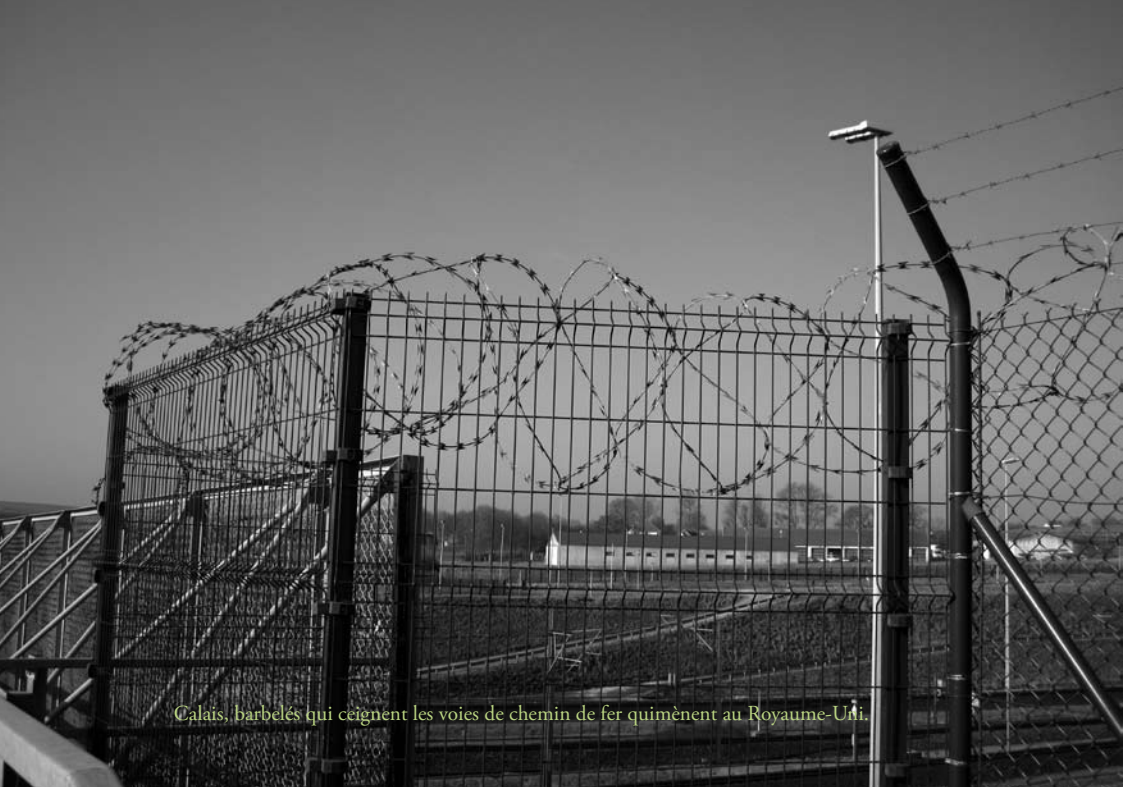
Calais, barbelés qui ceignent les voies de chemin de fer quimentent au Royaume-Uni.