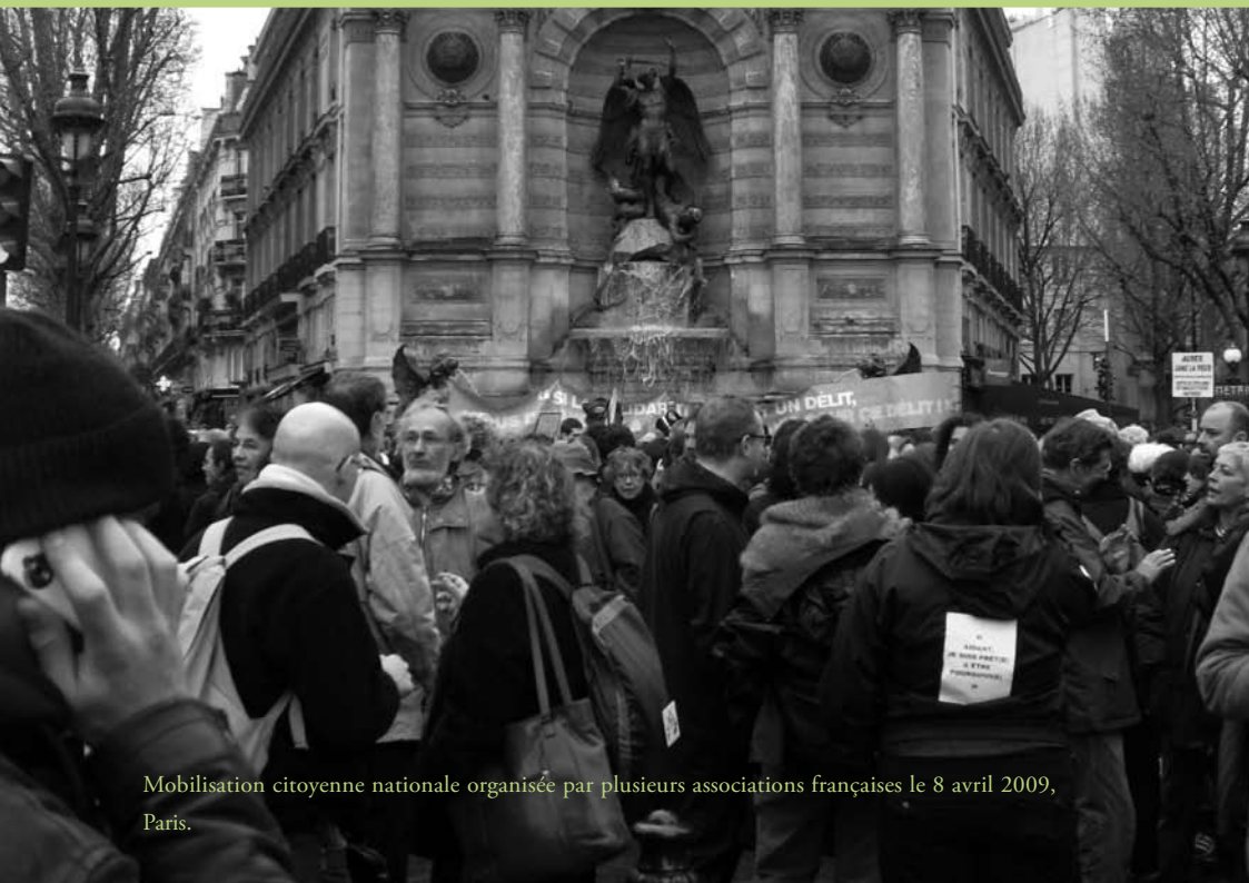
Mobilisation citoyenne nationale organisée par plusieurs associations françaises le 8 avril 2009, Paris.