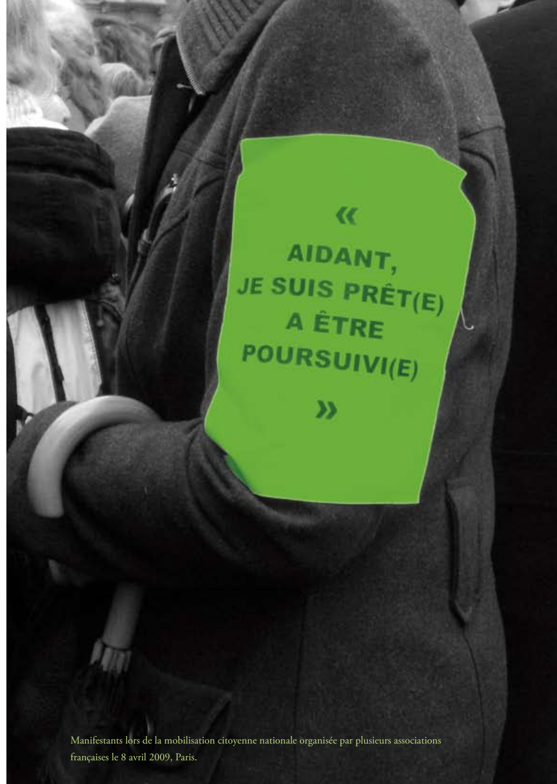
Manifestants lors de la mobilisation citoyenne nationale organisée par plusieurs associations françaises le 8 avril 2009, Paris.