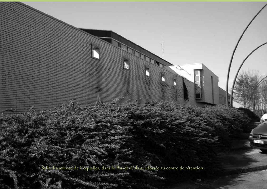
Salle d'audience de Coquelles, dans le Pas-de-Calais, adossée au centre de rétention.