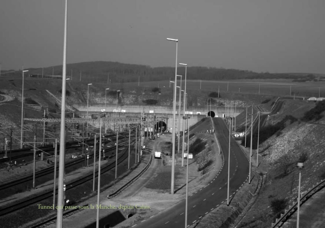
Tunnel qui passe sous la Manche, depuis Calais.