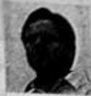
EDUARDO MEDINA MORA, SECRETARIO DE SEGURIDAD PÚBLICA.

“ No se tiene ninguna imputación directa de conductas violentas por parte de los policías federales preventivos que participaron en el operativo para restablecer el orden.”