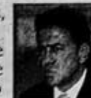
MIGUEL ÁNGEL YUNES, SUBSECRETARIO DE LA SSP.

“ Si existieron violaciones, tendrá que ser el MP el que lo determine... no se puede prejuzgar, calificar o señalar que hubo una violación mientras no se dé una denuncia concreta.”